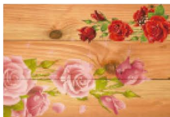
Directo a madera